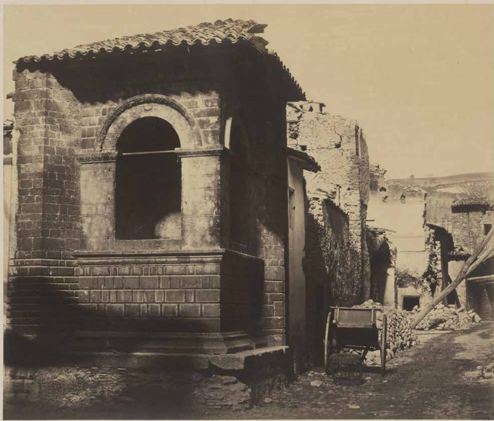
Robert MacPherson, Street View in Norcia, after the Earthquake, from casa Cipriani, 1860-1861.